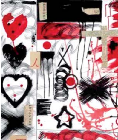
Pablo Echaurren "Cina addio" 1989, tecnica mista su carta esposto al MIAAO Museo Internazionale delle Arti Applicate Oggi. Torino - ITALY